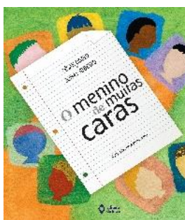
4º TÍTULO: O MENINO DE MUITAS CARAS Autores: César Obeid; Jonas Ribeiro Editora: Brasil