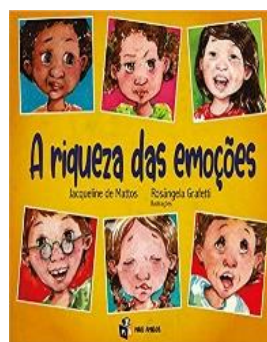
3º TÍTULO: A RIQUEZA DAS EMOÇÕES Autora: Jacqueline de Mattos Editora: Mais Amigos