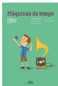
2º TÍTULO: MÁQUINAS DO TEMPO Autores: Cassiana Pizaia; Rima Awada; Rosi Vilas Boas Editora: Editora do Brasil