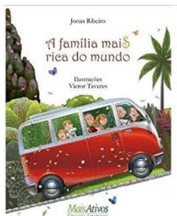
1º TÍTULO: A FAMÍLIA MAIS RICA DO MUNDO Autor: Jonas Ribeiro Editora: Mais Ativos