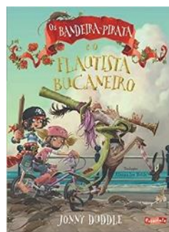
3º TÍTULO: OS BANDEIRA-PIRATA E O FLAUTISTA BUCANEIRO Autor: Jonny Duddle Editora: Escarlate