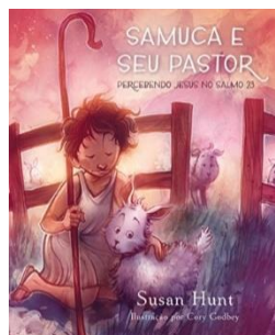
4º TÍTULO: SAMUCA E O SEU PASTOR Autora: Susan Hunt Editora: Fiel